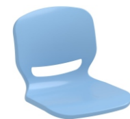
AZUL PASTEL 2169