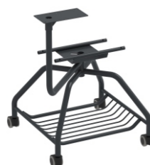
GRAFITO RAL 7021