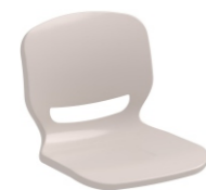
GRIS PARDO 406