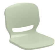
VERDE PASTEL 623