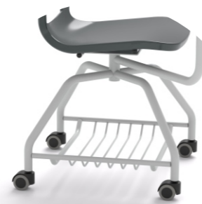
Ruedas 4 ruedas de poliamida