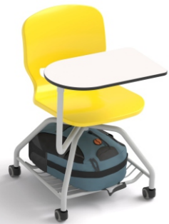
Bandeja inferior Para mochilas y objetos

Pala de 500x300 mm. fabricada en Compacmel de 13 mm. Puede rotar 360° para situarse en cualquier posición alrededor del asiento.