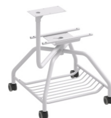
GRIS RAL 7035